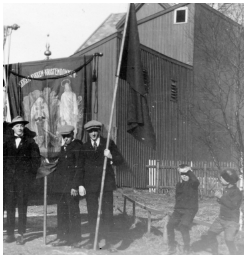
Arbeidarrørsla fekk tidleg problem med å få aksept for sine politiske symbol og saker. Politiet nekta lenge arbeidarungdomslaget i Bodø å bruke fana «Krigen - Kirken - Kristendommen» der ein gråtande Jesus såg på mens presten velsigna kanonen.